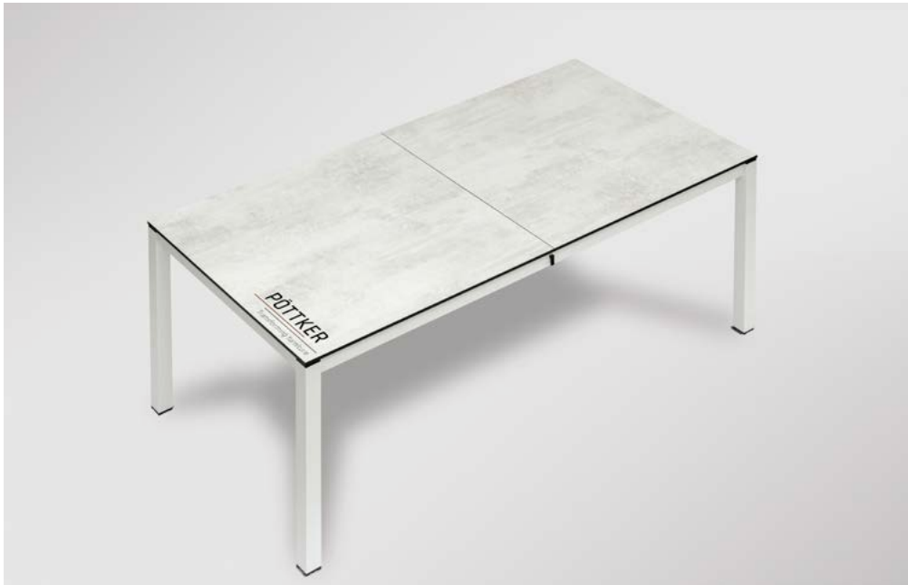
GESCHLOSSEN | CLOSED