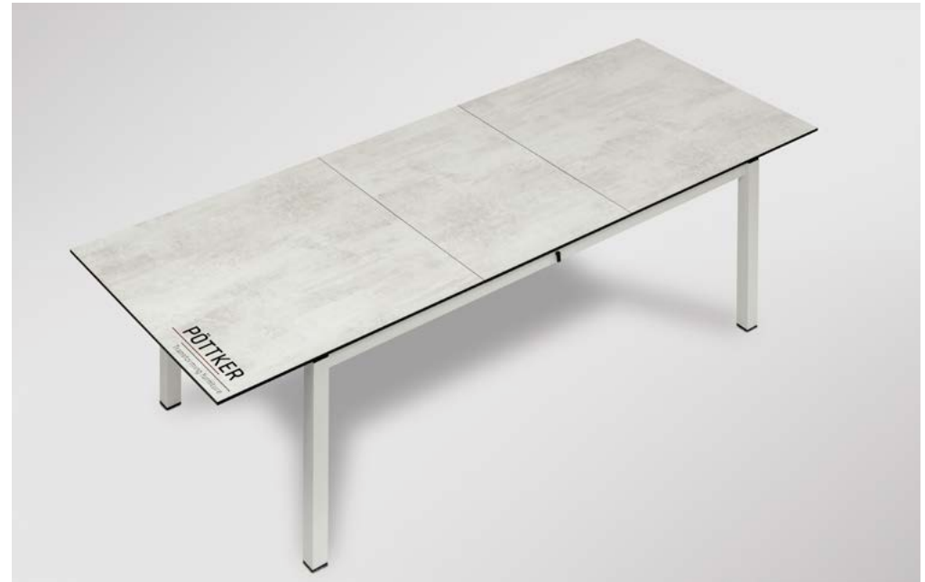
GEÖFFNET | OPEN